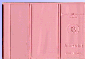
ŘP vydány v období: 1987-1991