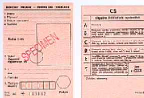
ŘP vydány v období: 1992-1993